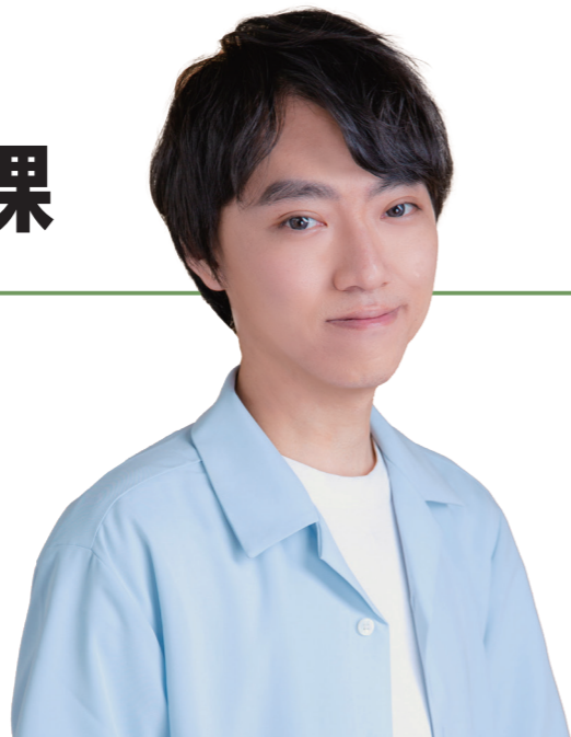
文 / 趙逸帆老師